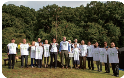
2019年姉妹都市締結10周年記念の植樹をしました！