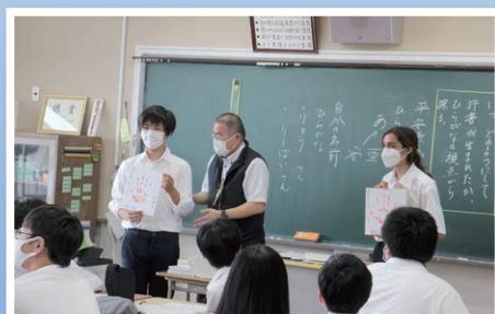
学校体験で手形を作成しました。