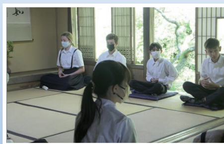
向上庵にて座禅体験。