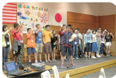
パロアルト市の中学生を迎えて 歓迎パーティー！

ネイバーズアブロードは、昭和38(1963)年からパロアルト市と協力して活動している非営利のボランティア団体です。友情、教育、商業、持続可能性を通じて、パロアルト市の国内及び国際的交流を促進することを目的としています。土浦のほか、リンシェーピン(スウェーデン)、ハイデルベルグ(ドイツ)、エンスケーデ(オランダ)、パロレイテ(フィリピン)、ヤンプー(中国)、オアハカ(メキシコ)、アルビ(フランス)、ブルーミントン(アメリカ)の計9つの姉妹都市をもち、それぞれの都市と多岐にわたる交流を行っています。例を挙げると、アルビ(Albi)とは、市民のホームステイ交流や合唱グループの共同コンサート交流を行っています。パロレイテ(Palo, Leyte)とは、交流の他、図書館の設立や高校生への奨学金プログラムなど支援事業もを行っています。