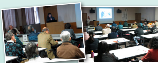
現地の貴重な話を聞けました 活発な質問が出ていました

チュニジアとメキシコで、JICAボランティアとして活動されたお二人を講師に迎え、各国の実情や活動内容などについて講演していただきました。大勢の受講者は熱心に耳を傾けていました。(1月17日)