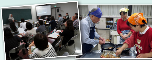
貴重な言語を学びました インドネシア料理にも挑戦!

インドネシア出身の講師の指導のもと、14人の受講者が12回にわたって言語を学ぶほか、料理作りなどを通じて、インドネシアの言語と合わせて国の文化への理解を深めました。(9月24日～12月10日)