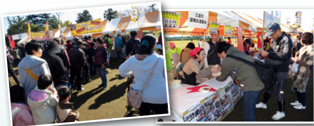
ブース前は連日長蛇の列 インドカレーお待たせしました!

今回から2日間の参加となった土浦カレーフェスティバル。秋の晴天の下、協会ブースは両日とも大盛況で、大勢のお客様にお馴染みとなったインドカレーを味わっていただきました。(11月15日、16日)