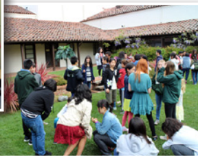
◀「日本／土浦まつり」 市民訪問団派遣