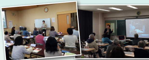
外国人の生活をサポートします! 指導方法の工夫を学習

日本語ボランティア養成講座の初級編には23人、レベルアップ編には26人が受講しました。今後も日本語教室の生徒の増加が予想される中、ボランティア教師としての活躍が期待されます。(10月～2月)