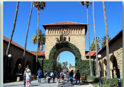
パロアルトに隣接するスタンフォード大。とにかく広大なキャンパスにビックリ！