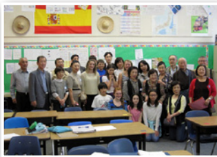
中学生交換交流事業 ▶ パロアルト市派遣

旧新治村のときから行ってきた、中学生のホームステイを中心とした交換交流事業がきっかけとなり、平成21(2009)年、姉妹都市になりました。現在は、中学生交換交流事業のほかにも「かすみがうらマラソン大会」における招待選手との交流やパロアルト市で開催される「日本／土浦まつり」への市民訪問団派遣などの交流を行っています。