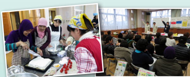
いちごケーキ製作中! 市の職員によるごみの講習会

外国人と日本人が、ひな祭りにちなんだ春らしい和食作りを行いました。楽しく食事と交流をした後は、調理で出た生ごみなどを使いながら、4月から始まる新しいごみの出し方を学びました。(3月1日)