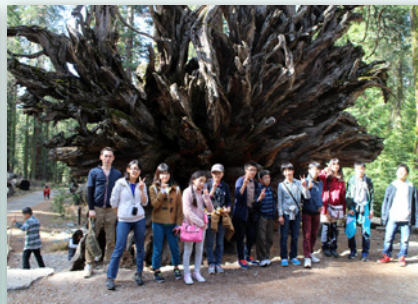
雄大な景色が広がる、世界遺産ヨセミテ。大自然の偉大さに圧倒されました。