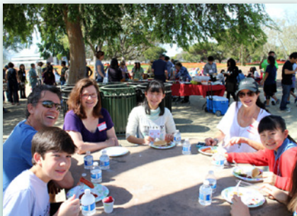
ホストファミリーに会うまでは少し不安だったけど、すぐに仲良くなれました。

この事業を通じて中学生が視野を広げ、国際感覚を磨くとともに将来に役立つ貴重な経験を得ることができました。6月には、パロアルト市の中学生を受け入れます。今回の派遣生が中心となり、多くの中学生に国際交流の楽しさを広げてほしいと思います。