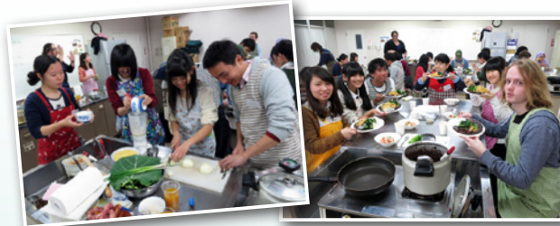
珍しい食材に興味津々! 熱々の『フェイジョアダ』です

ブラジル出身の講師による指導のもと、市内の中高生と外国人がブラジル料理を作りました。ポリウムたっぷりの料理を食べながら、参加者同士が出身国を紹介するなど、交流を深めました。(12月21日)