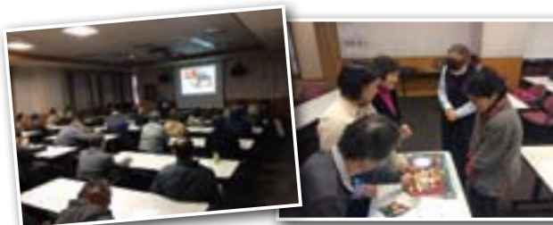
見事なプレゼンに引込まれる 現地グッズに興味津々

JICAのプログラムである出前講座により実現。中米エルサルバドルとモンゴルでそれぞれ活動し、任務を終えたばかりの青年海外協力隊2名を招き、現地での貴重な体験をお聞きしました。(1月20日)