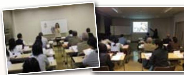
講師は現地ベトナム出身 動画で母国をリアルに紹介

近年交流が活発化し、出身者が急増中のベトナム。親日的で日本とよく似た国民性を持つことで知られます。発音に戸惑いつつも、明るい講師のもと最後まで楽しく学習しました。(10月4日～12月20日)