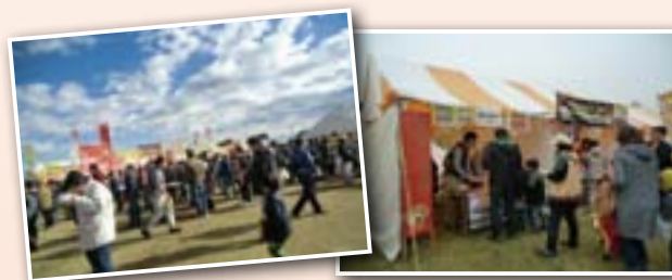
当日は大勢の方々と賑う 地元TVに取り上げられました

ご当地カレーをはじめ、全国のB級グルメが集まるカレーフェスティバルに出店しました。産業祭との同時開催により会場は盛況となり、インドカレーは瞬く間に完売となりました。(11月18日・19日)