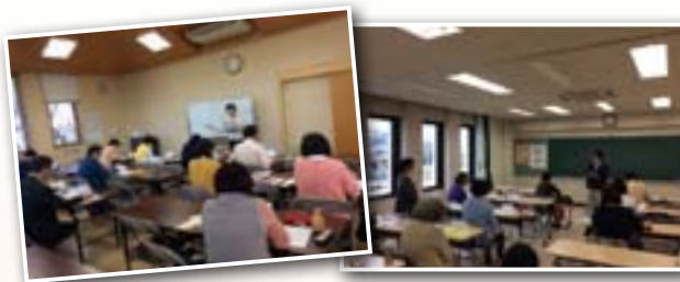
丁寧な講義で受講生から好評 初心者にも学びやすいテーマ

留学生や実習生など、市内には様々な立場で日本語に苦戦している外国出身者がおります。そのような人を支援するボランティアを養成する講座を、10回にわたり開催しました。(10月21日～1月13日)