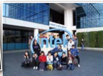
シリコンバレーのIT企業を見学