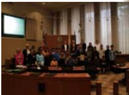
パロアルト市議会を表敬訪問