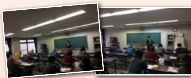
教える側の悩みは様々 改めて指導の難しさに向き合う

現在日本語指導で活躍するボランティア講師の方々向けに開催。普段の活動から生まれてくる悩みや課題について具体的な解決方法を探り、さらなるレベルアップを図りました。(11月8日～1月10日)