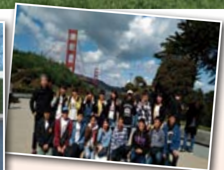
サンフランシスコにも立ち寄りました