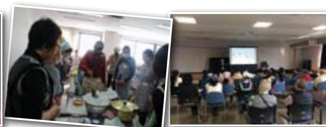
カレー作り講師は現地出身

外国人と日本人が日常生活について学びながら交流を深める場を提供するプログラム。今回はスリランカ・タイ・日本各国のカレーを一緒に作りランチで交流し、ごみの出し方を学びました。(2月18日)