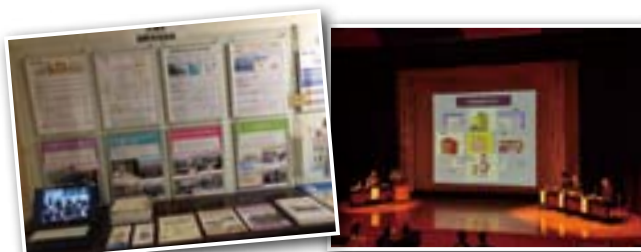
当協会の展示コーナー

市民と行政の「協働」の活性化のため開催されているシンポジウム。市民団体のひとつとして、パネル・パンフレットの掲出や映像の上映により協会の活動を多くの来場者に紹介いたしました。(1月27日)