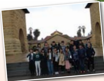
スタンフォード大学キャンパスにて