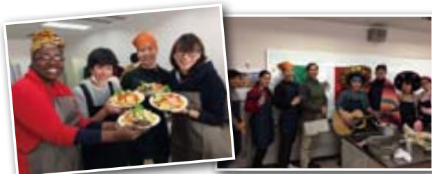
これなら家でも作れそう♪ 民族衣装に大興奮!

外国の食文化を通じて国際理解を深めるため、日本の中高生と外国人がメキシコ料理を一緒に作りながら楽しく交流しました。珍しい食材ありご当地グッズありで、メキシコ三昧な一日でした。(12月10日)